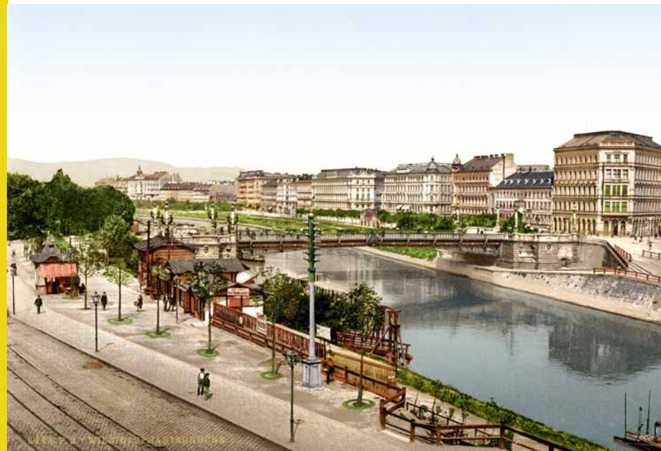
Wien, Stephaniebrücke, 1895