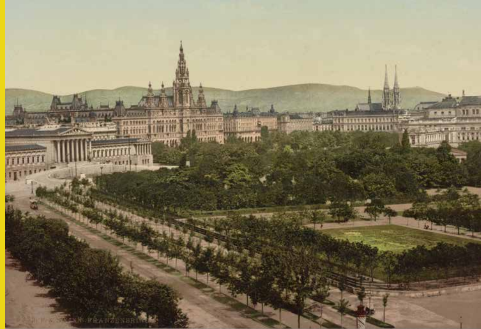
Wien, Franzensring, 1890