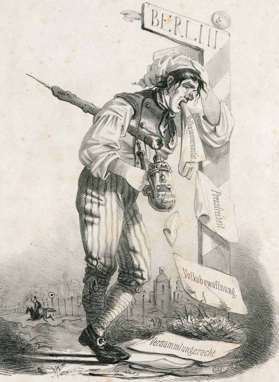
Wie der deutsche Michel Alles wiedervon sich gibt.

Das stockende Hauptthema des Kopfsatzes ist zwar rhythmisch prägnant geformt, tonal aber mehrdeutig. Während der ganzen Exposition wird die Grundtonart c-Moll eher umkreist, denn als Basis für das tonale Geschehen vorausgesetzt. Im ersten Themenkomplex spielt neben den scharfen Punktierungen der so genannte Bruckner-Rhythmus – die Verbindung von zwei Vierteln und einer Triole – eine wesentliche Rolle. Auch das kantabel aufsteigende Seitenthema, das sich gleichfalls zu einem Komplex ausweitet, ist davon bestimmt. In der Tradition des 19. Jahrhunderts, das den klassischen Themendualismus der Sonatenhauptsatz-